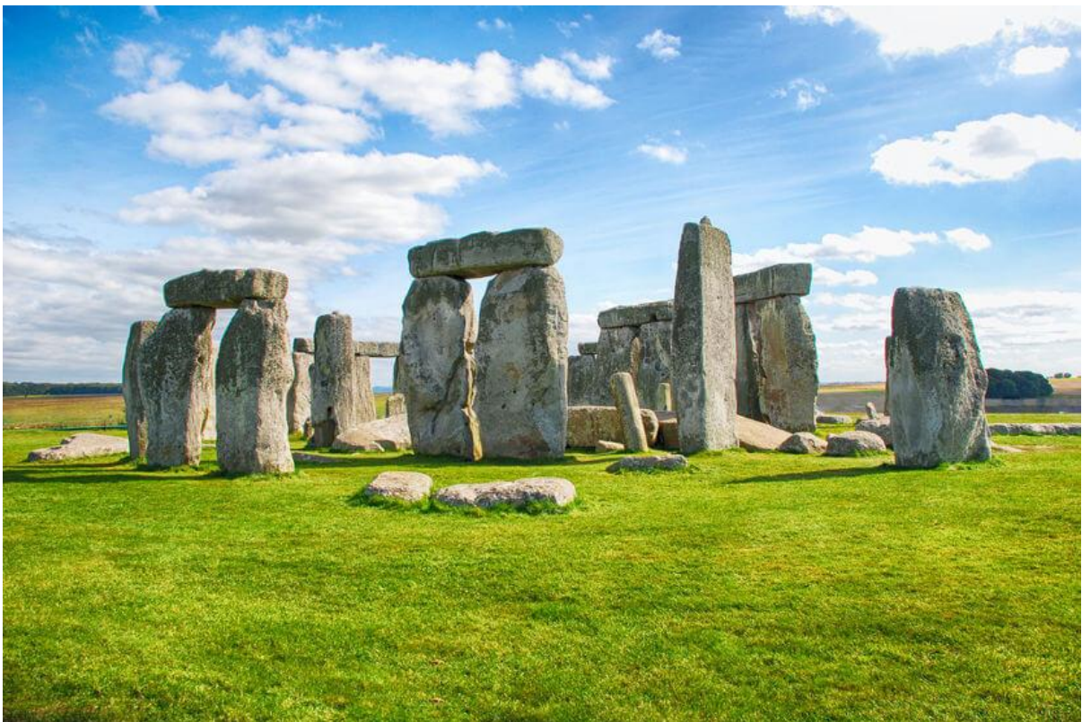
No Neolítico, destacam-se as construções megalíticas, como a de Stonehenge, na Inglaterra.

Isso permitiu que o homem desenvolvesse novas ferramentas, que trouxeram melhoria para a sua vida. Um dos grandes avanços do Neolítico está relacionado com as construções, uma vez que pouco a pouco o homem foi desenvolvendo habilidades arquitetônicas.