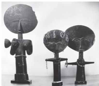
Bonecas da fertilidade, etnia Ashanti, Gana.

Visual encyclopedia of art: arte africana. Itália: Scala Group, 2010.