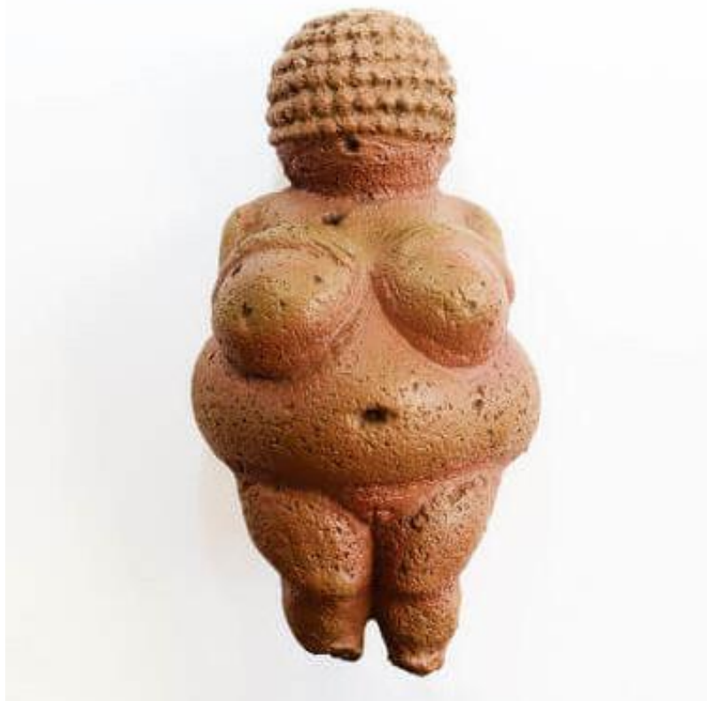
A Vênus de Willendorf foi localizada na Áustria e é uma das estatuetas de Vênus mais famosas.

Os especialistas falam que a arte rupestre utilizava materiais como terra, carvão, sangue, flores etc. Os principais exemplos dessa arte são encontrados na Caverna de Chauvet e Lascaux , na França, mas também estão em outros locais, como Espanha, Austrália, Argentina etc. Aqui no Brasil o grande centro de arte rupestre fica na Serra da Capivara , localizada no Piauí.