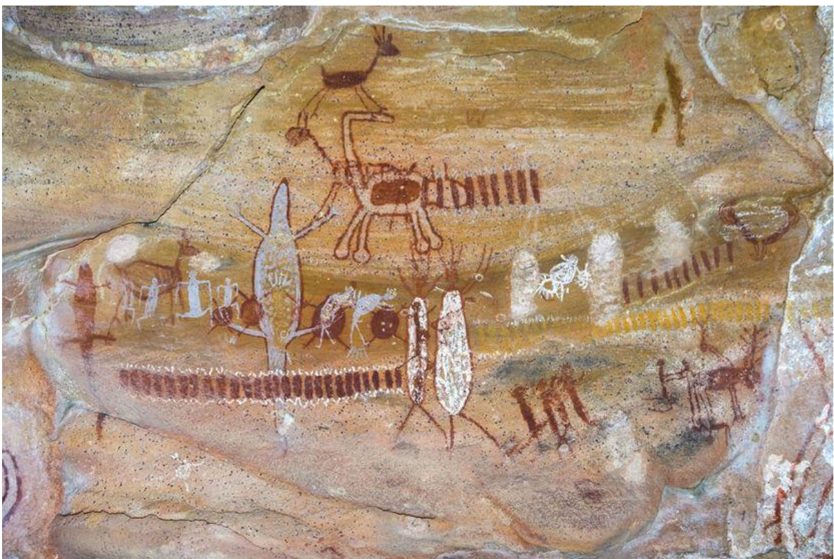
A Serra da Capivara é um dos sítios de pintura rupestre mais famosos do Brasil.